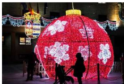
Iluminación Navidad 2020

Elaborado por la Asociación Histórico Cultural Dos de Mayo.