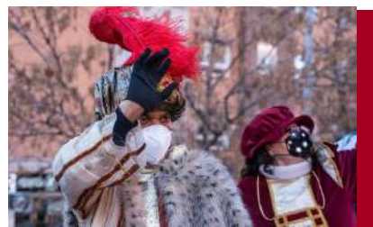
Autobús Reyes Maaos. Enero 2021