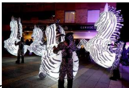
Encendido luces año 2019

PASACALLES NAVIDEÑO PARQUE COIMBRAGUADARRAMA