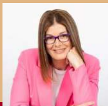
Noelia Posse Alcaldesa de Móstoles

Os deseo unas Felices Fiestas, instantes llenos de vida y de amor, pero también os sigo pidiendo un último esfuerzo, precaución con la COVID-19, no podemos echar por la borda todo el esfuerzo que hemos realizado hasta llegar aquí, sigamos cuidándonos.